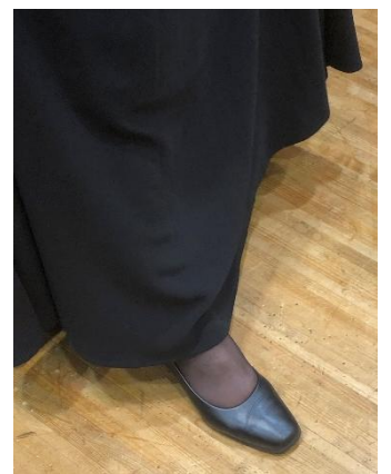
飾りのない黒靴 靴底も黒で