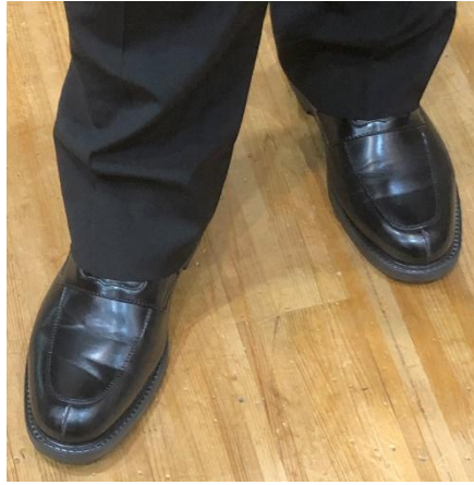
飾りのない黒革靴