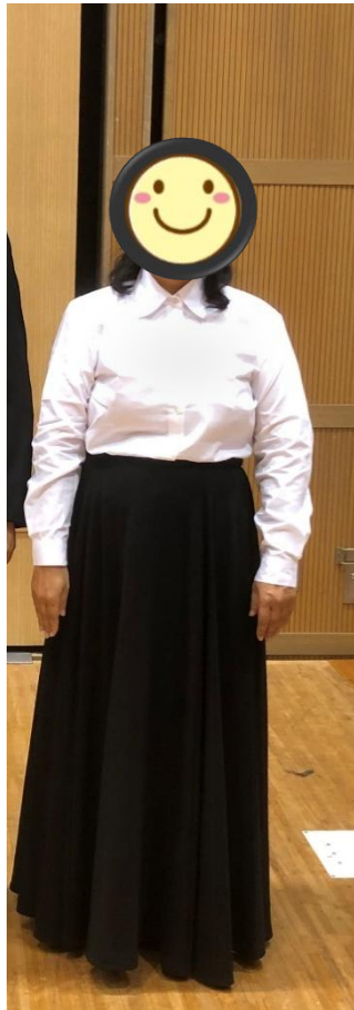
白ボタン 肌の透けない生地 シンプルな襟