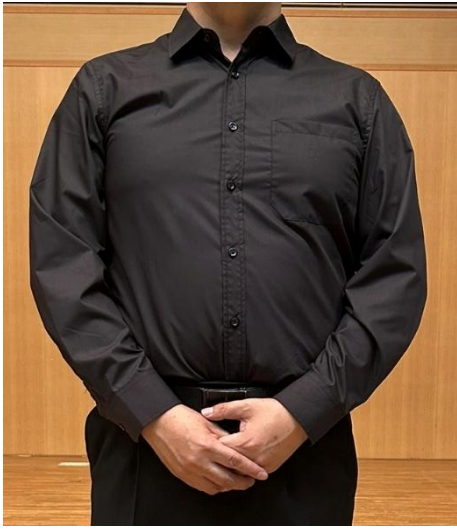
黒無地カッターシャツ ボタンも黒で