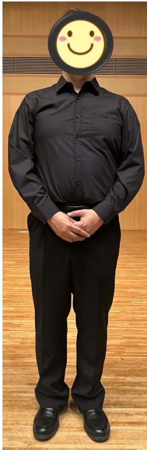
黒スラックス 黒靴下