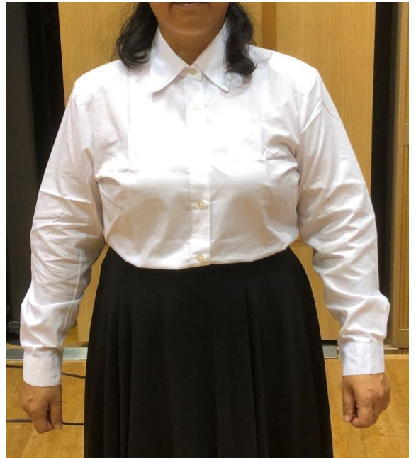
裾はスカートに入れる