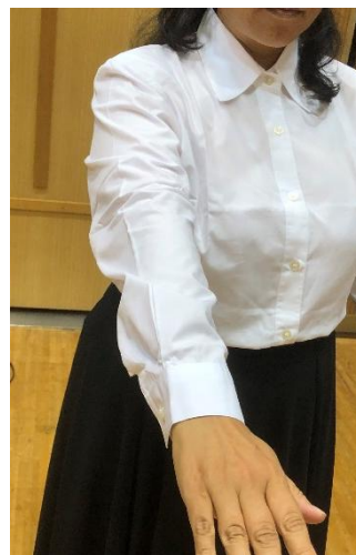
袖は手首までの長さ